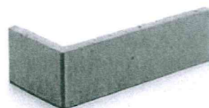
Type de briquette à assembler unité par unité.

L'emploi à nu en parement extérieur de matériaux destinés au départ à être enduits ou peints (briques creuses, parpaings d'aggloméré, etc ...) est interdit. Les plaques de parement brique (distinctes de la pose de briquettes par unité qui reste autorisée) sont interdites ; de même sont interdits les placages de matériaux tels que le carrelage.